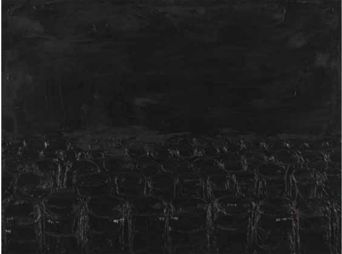
Nero - Paesaggio , 2009 olio su tela, 60x80 cm