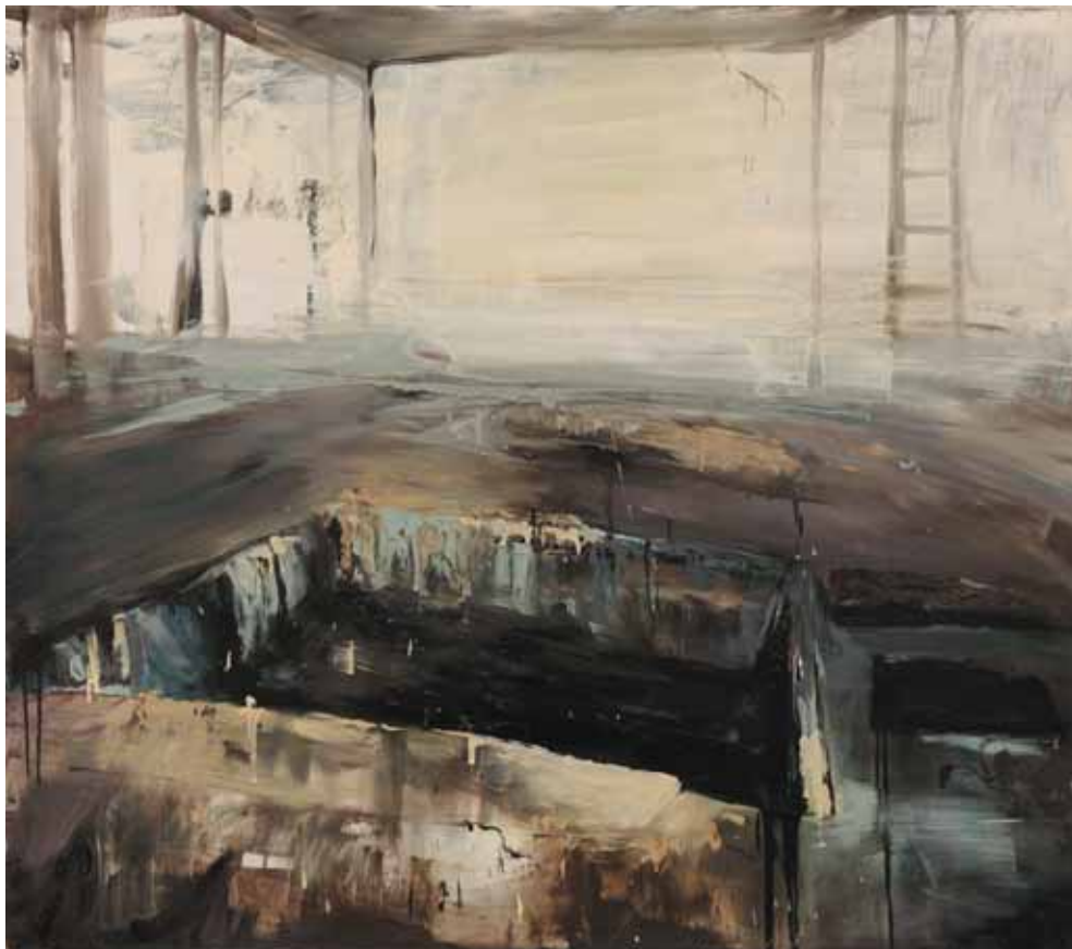
Untitled , 2009 olio su tela, 142x162cm