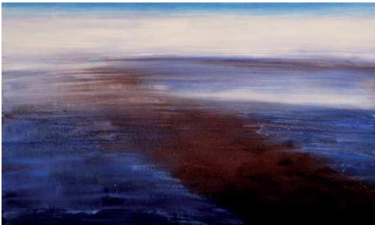
Vastità d'orizzonte , 2011 tempera e acquerello su tavola 75x125 cm