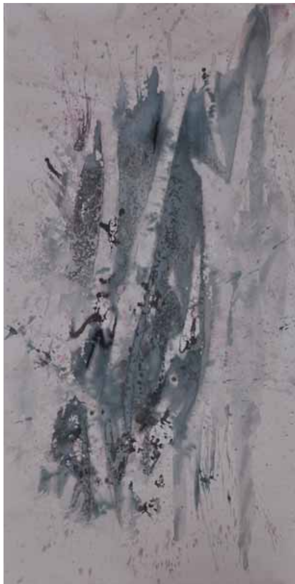
Ártéri fák ( Alberi alla foce ), 2011 Tecnica mista su carta, 190x100 cm

È nata nel 1989. Frequenta il terzo anno all'Università di Scienze di Szeged, Dipartimento Educatore/Insegnamento Artistico Juhász Gyula, Istituto d'Arte, Facoltà di Disegno Storia dell'Arte nella città di Szeged in Ungheria.