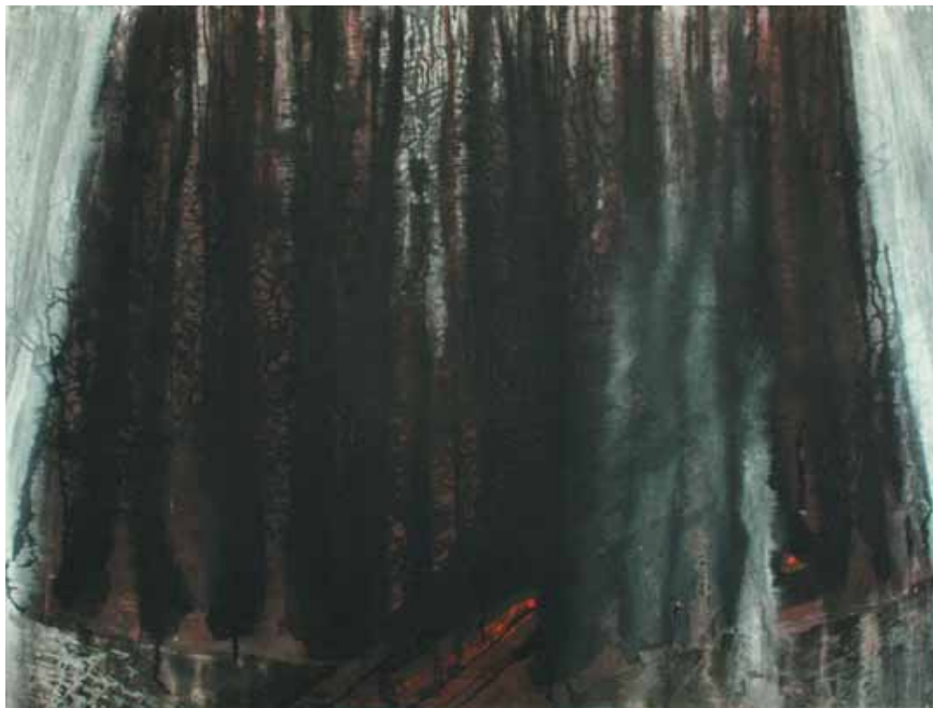
Poiat , 2011 acrilico su tavola, 106x142,5 cm