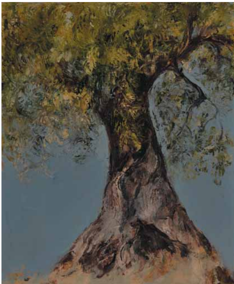
Contorsione , 1984 Olio su tela, 60x50 cm