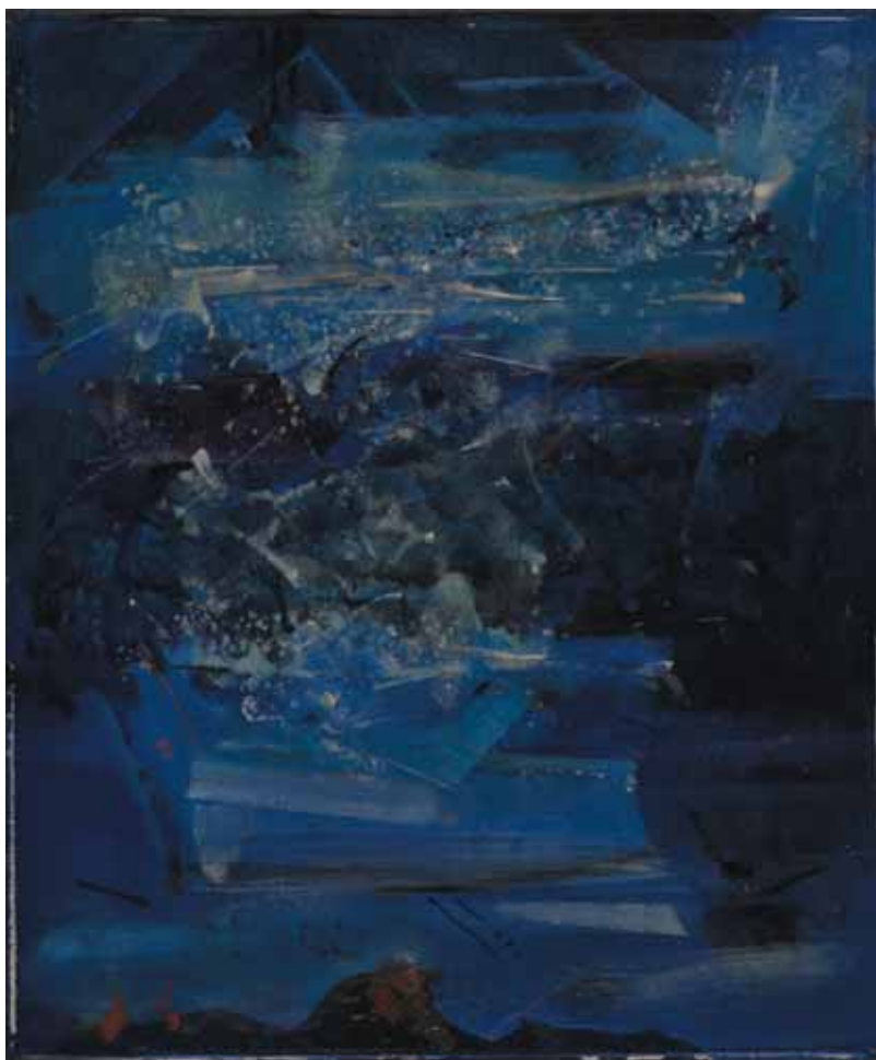
Come un mare blu , 1999 Olio su tela, 60x50 cm