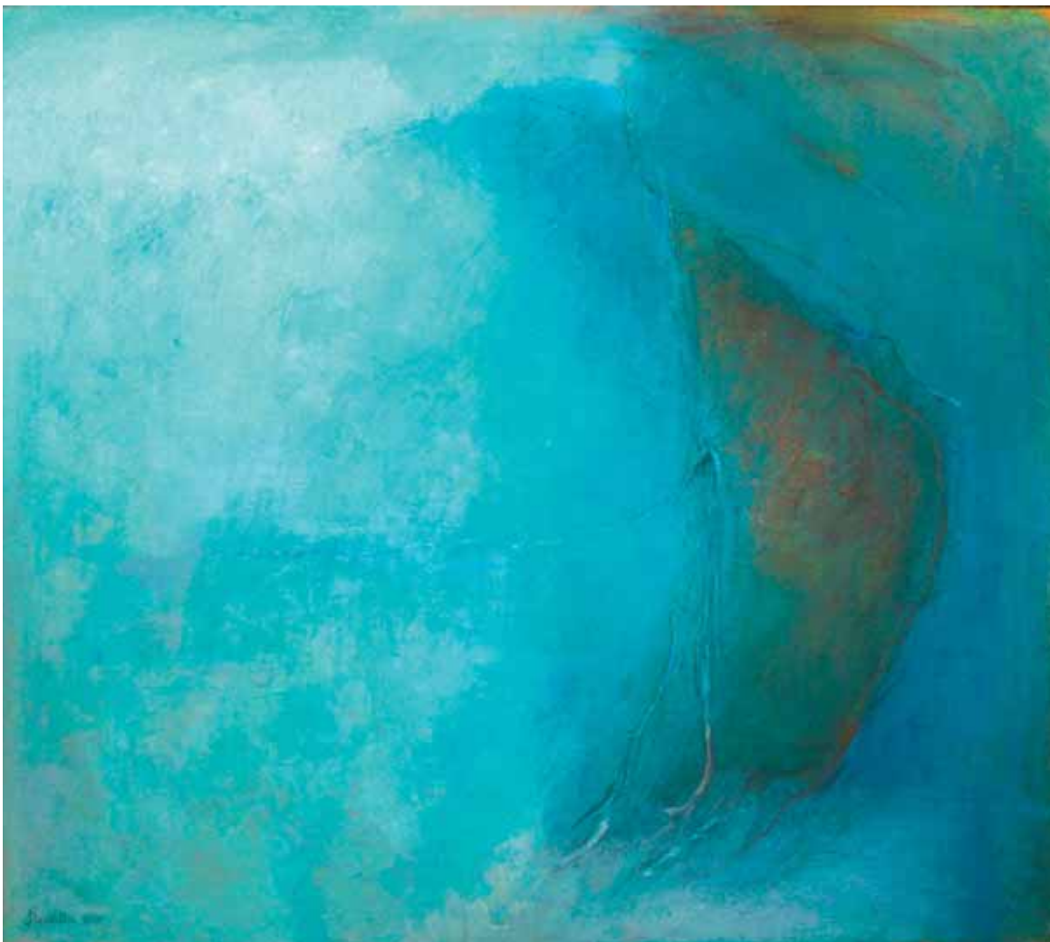
Nella luce del cielo, 2007 tecnica mista su tela, 152,5x136,5 cm