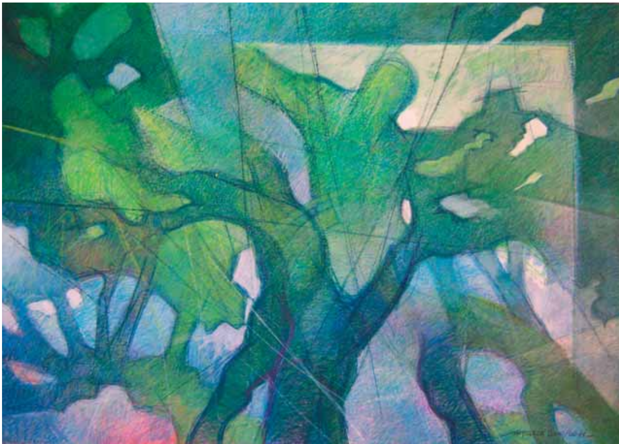
Metamorfosi nel bosco, 2000-2011 Tecnica mista su carta intelata, 100x140 cm