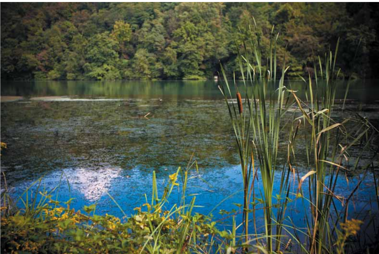
Il fiume Adda a Imbersago