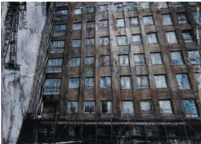
Antropico -Naturale VII , 2011 dittico, olio e tecnica mista su tela, 2 . 50x70 cm