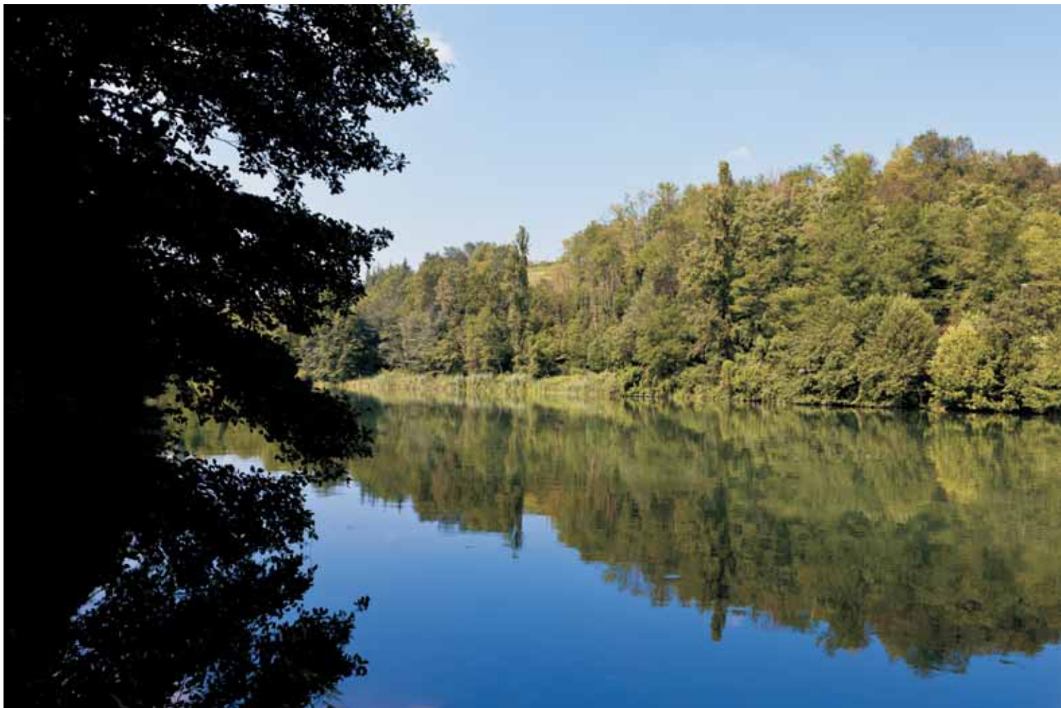
Il fiume Adda a Imbersago