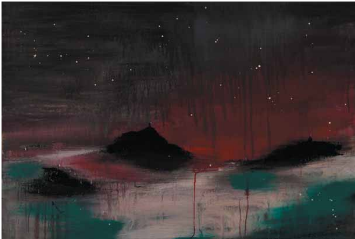
Paesaggio italiano con tricolore, 2011 Tecnica mista su tela, 80x120,5 cm