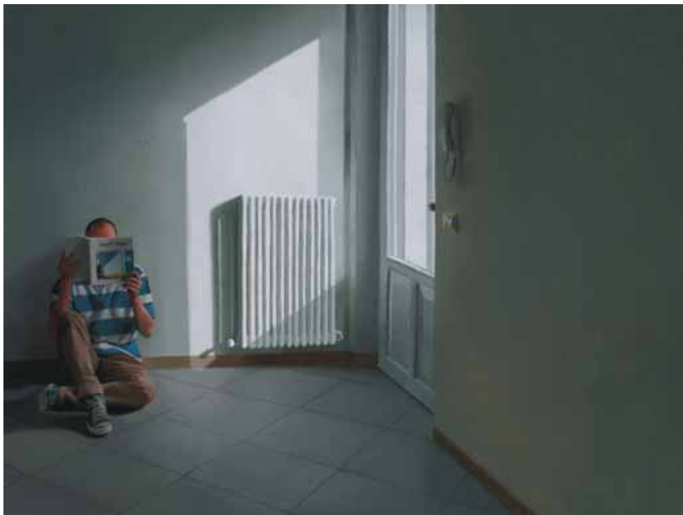
Hopper, 2010 Olio su tela, 60x80 cm