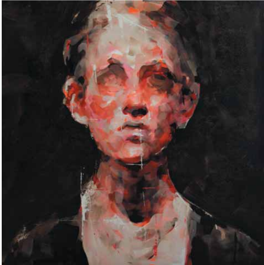
Mari , 2011 Tecnica mista su tela, 60x60 cm